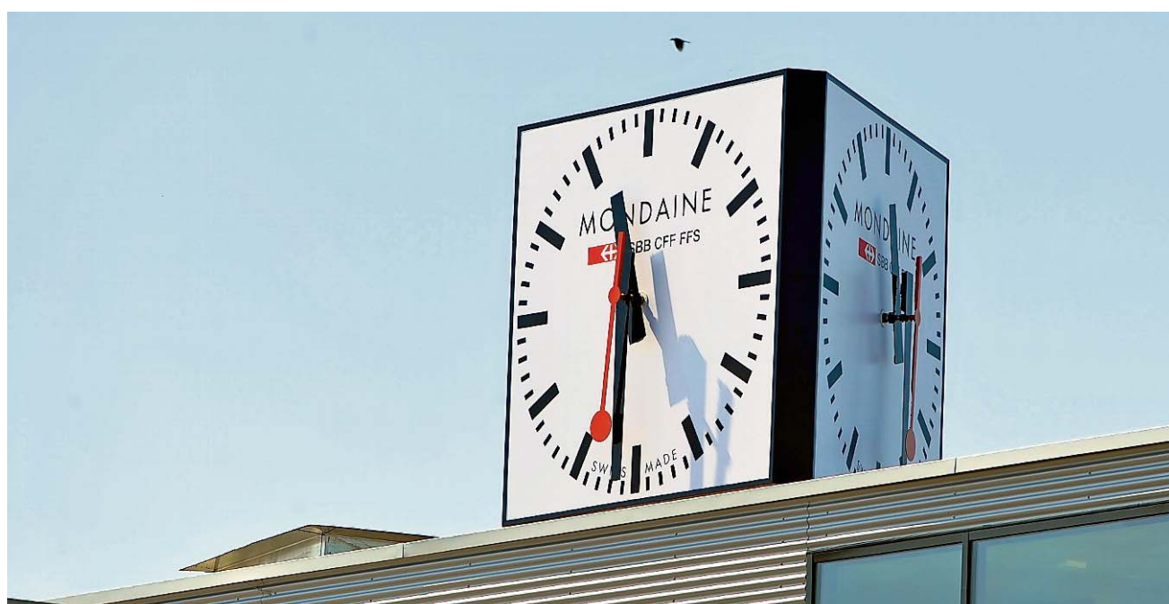
Gerichtlich bestätigt: Die Markenrechte an der M-Watch gehören der Biberister Mondaine.

Nach dem Verbot an die Migros, Uhren unter der Marke M-Watch zu verkaufen, «erwarten wir einen Schub auf dem Schweizer Markt.» Die seit 2010 laufende Zusammenarbeit mit der Warenhausgruppe Manor als neuer Absatzkanal laufe gut. Gegen 70 Modelle der Marke M-Watch werden in sämtlichen Manor-Filialen angeboten. Auch der im Herbst gestartete Verkauf der Uhr über die Online-Einkaufsplattform postshop.ch werde weitergeführt. Produktionszahlen will